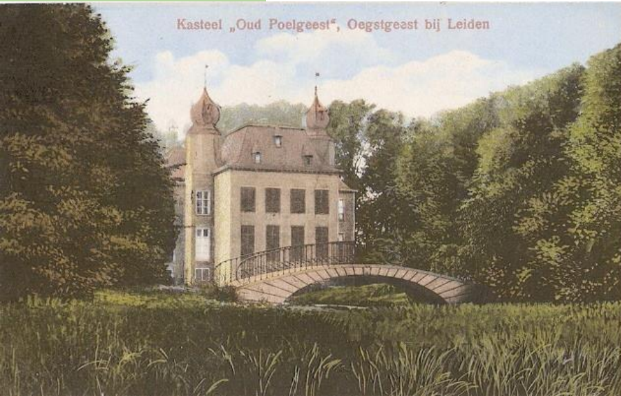
Kasteel „Oud Poelgeest“, Oegstgeest bij Leiden