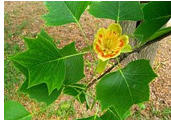
Blad en bloem van de tulpenboom (Wikipedia)

In het bosbouwboek uit mijn Wageningse studietijd door (niet lachen) dr. G. Houtzagers 1 , uit (weer niet) 1954, wordt al vermeld dat het hout voor veel doeleinden toepasbaar is. Dat komt, zo stelt de auteur door de volgende eigenschappen: ‘Het is licht, zacht, zeer buigzaam, gemakkelijk te bewerken en goed splijtbaar, neemt gemakkelijk verf en politoer (!) aan en is vrij duurzaam. Het wordt gebruikt voor muziekinstrumenten, draaiwerk, binnenbetimmeringen, meubels, fineer, kisten, houten gereedschappen, ‘excelsior’ houtwol, potloden, lucifers en cellulose’. En voor mijn huis in Amersfoort heeft een Soester fabriekje er een complete trapleuning van gemaakt – ook heel mooi.