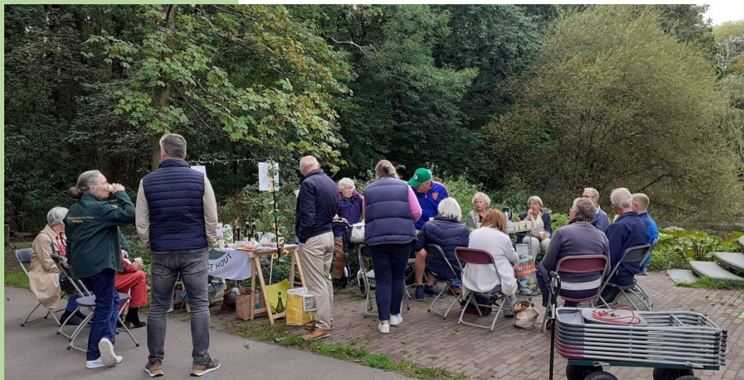
Vrijwilligers na afloop laatste Waterlelieconcert 2024

Namens het bestuur wil ik iedereen hele mooie, gezellige en duurzame feestdagen toewensen. Voor 2025 hopen we wederom op een mooi jaar met afwisselende activiteiten. En wellicht overbodig, maar denk in deze donkere maanden ook eens aan je oudere buurman of buurvrouw, of die stille jongen verderop in de straat.