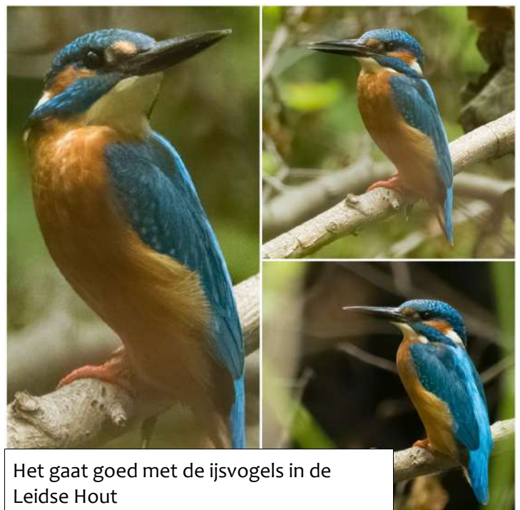
Het gaat goed met de ijsvogels in de Leidse Hout